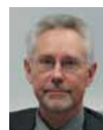
Wolfgang Witt Expansion & Immobilien- verwaltung, OBI GmbH & Co. Deutschland KG